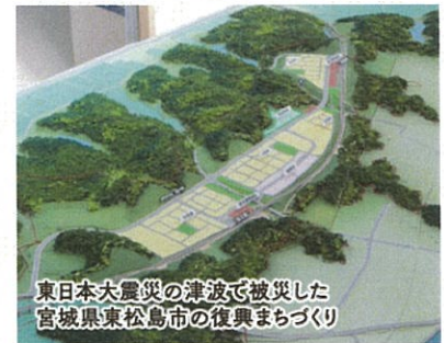
東日本大震災の津波で被災した宮城県東松島市の復興まちづくり

弊社では、東日本大震災後、復興支援に向けて仙台支店を中心に、被災住民の安全・安心な「新たなまち（集団移転先住宅団地・災害公営住宅団地）」の造成に係る詳細な事業計画の作成、住宅地整備に向けた調査・設計・管理及びまちづくり検討の総合支援等に携わっています。