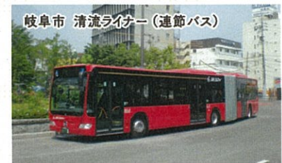
岐阜市 清流ライナー（連節バス）

弊社では、東日本大震災後、復興支援に向けて仙台支店を中心に、被災住民の安全・安心な「新たなまち（集団移転先住宅団地・災害公営住宅団地）」の造成に係る詳細な事業計画の作成、住宅地整備に向けた調査・設計・管理及びまちづくり検討の総合支援等に携わっています。