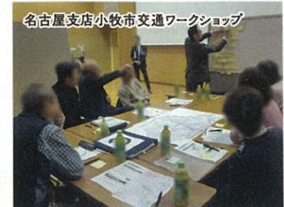
名古屋支店小牧市交通ワークショップ

地方鉄道や路線バス等の地域公共交通に関する計画策定の支援とワークショップ等の地域住民との対話を通じ利用者目線での計画づくりを行っています。