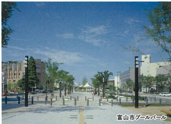
富山市ブルーパール