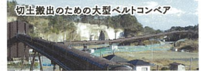
切立搬出のための大型ベルトコンベア