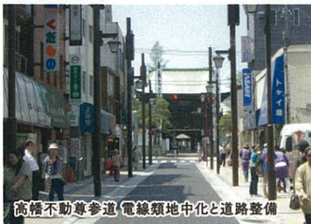
高橋不動尊参道・電線類地中化と道路整備

都市の主要な公共空間の計画・設計にあたり、賑わい・交流の場や歩きたくなる場づくりを進めるとともに、地域に愛される場となることを目指しています。