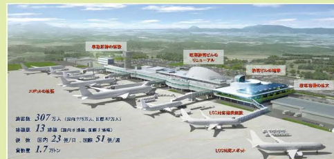
~ 複数のLCCの拠点化を進め、旅客数307万人を達成 ~